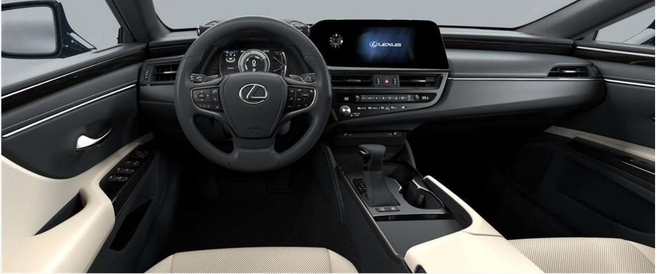
AMMONITE SAND & Bamboo wood (LUXURY / LUXURY PREMIUM)