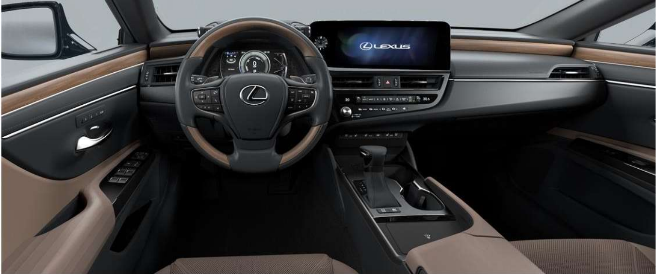
FOREST BROWN & Black wood (LUXURY / LUXURY PREMIUM)