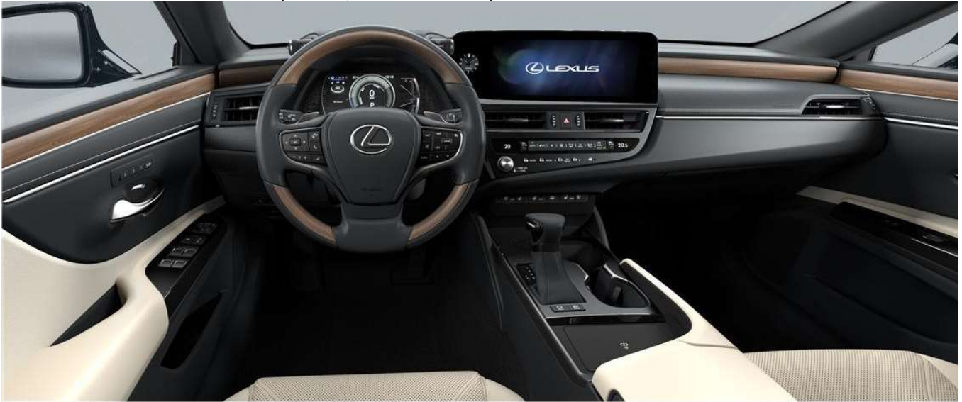
AMMONITE SAND & Black wood (LUXURY / LUXURY PREMIUM)