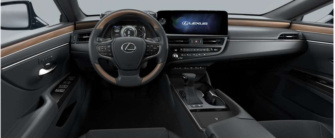
BLACK & Black wood (LUXURY / LUXURY PREMIUM)