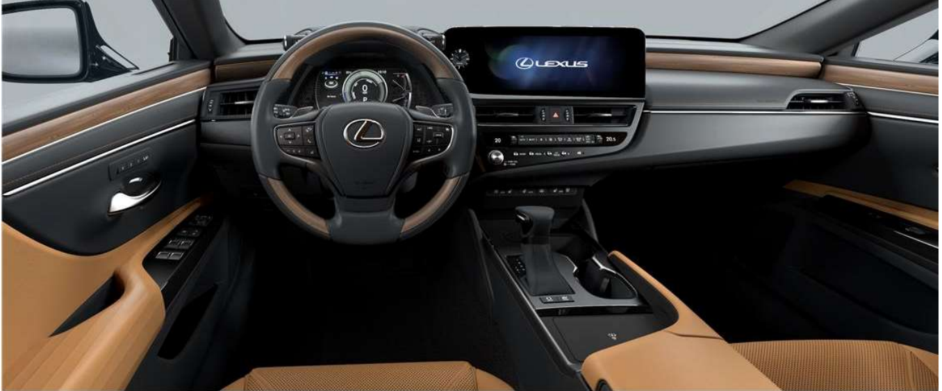
HAZEL & Black wood (LUXURY / LUXURY PREMIUM)