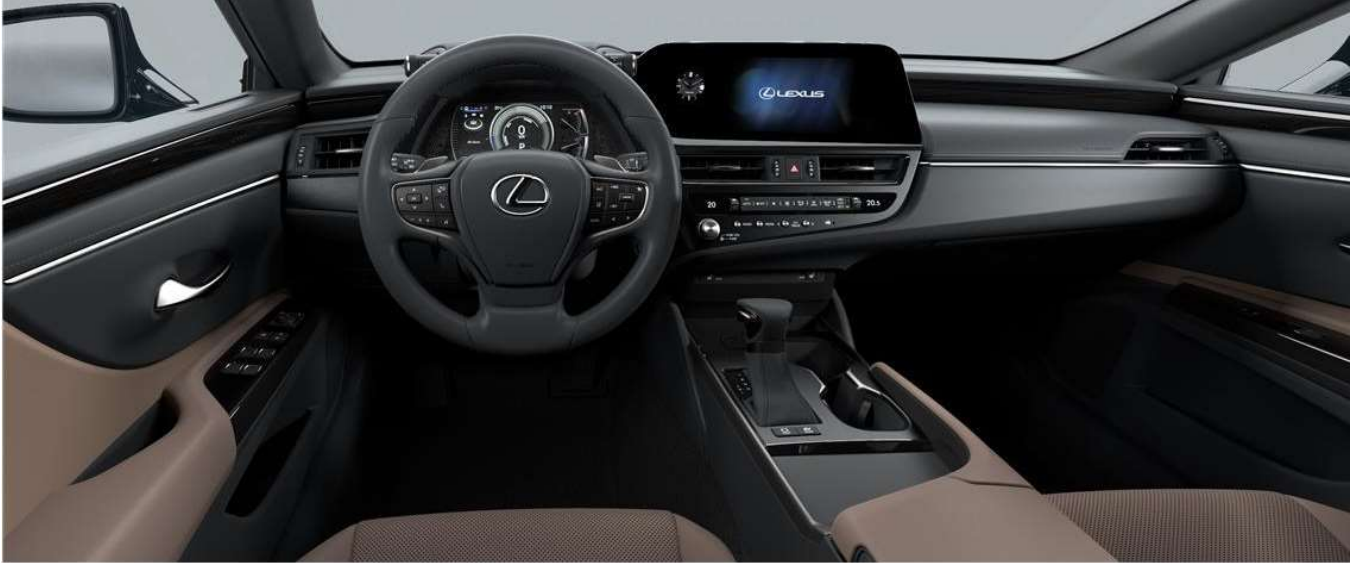
FOREST BROWN & Bamboo wood (LUXURY / LUXURY PREMIUM)